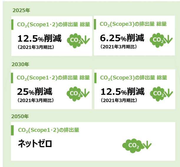
当社グループのCO 2 排出量削減の中長期目標（2021年10月改定）

また、気候変動に関連したリスク・機会に関する情報開示の高まりを受け、当社グループは、2021年11月に気候関連財務情報開示タスクフォース（TCFD：Task Force on Climate-related Financial Disclosures）の提言への賛同を表明しました。TCFDの提言に基づく情報開示として、不確実性の高い気候変動の影響を捉えるため、シナリオ分析を行いリスクと機会を定性的に評価しています。検討に際しては、移行リスクが大きくなる世界（1.5℃、2℃）、物理的リスクが大きくなる世界（4℃）を想定し、発生し得る事象を整理しました。各事象への備えとして、「短期：1年」「中期：5年」「長期：10年」の時間軸を設定し、事業への潜在的影響および対応事項を整理するとともに、事業リスクおよび機会について分析しました。