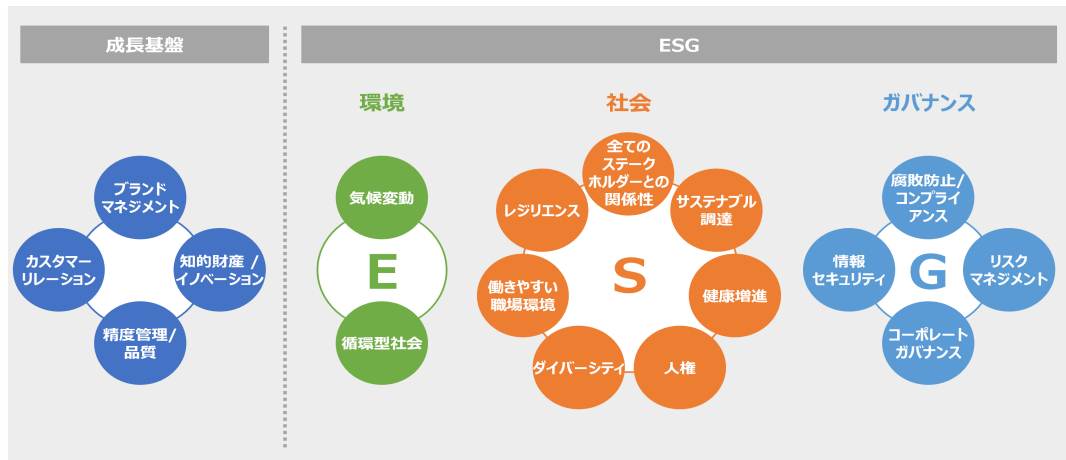
当社グループのマテリアリティ（2021年7月改定）

さらに、当社グループでは、マテリアリティの解決に向けて取り組みを進めるため、2021年3月期から2023年3月期までのサステナビリティ活動に関わるKPIおよび3カ年目標を「サステナビリティ・ロードマップ」として公表しています。