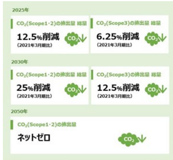
当社グループのCO 2 排出量削減の中長期目標（2021年10月改定）

また、気候変動に関連したリスク・機会に関する情報開示の高まりを受け、当社グループは、2021年11月に気候関連財務情報開示タスクフォース（TCFD：Task Force on Climate-related Financial Disclosures）の提言への賛同を表明しました。TCFDの提言に基づく情報開示として、不確実性の高い気候変動の影響を捉えるため、シナリオ分析を行いリスクと機会を定性的に評価しています。検討に際しては、移行リスクが大きくなる世界（1.5℃、2℃）、物理的リスクが大きくなる世界（4℃）を想定し、発生し得る事象を整理しました。各事象への備えとして、「短期：1年」「中期：5年」「長期：10年」の時間軸を設定し、事業への潜在的影響および対応事項を整理するとともに、事業リスクおよび機会について分析しました。