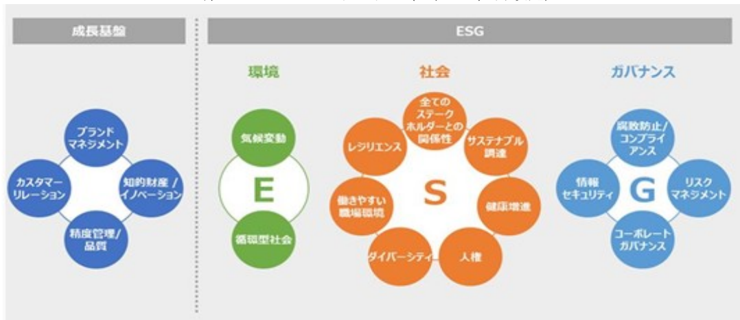
当社グループのマテリアリティ（2021年7月改定）

さらに、当社グループでは、マテリアリティの解決に向けて取り組みを進めるため、2021年3月期から2023年3月期までのサステナビリティ活動に関わるKPIおよび3カ年目標を「サステナビリティ・ロードマップ」として公表しています。